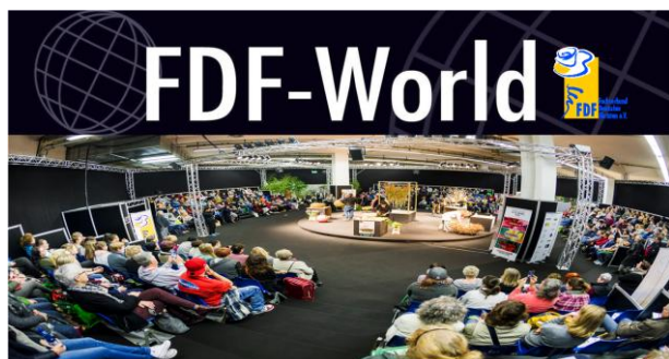
FDF-World, Foto: IPM ESSEN