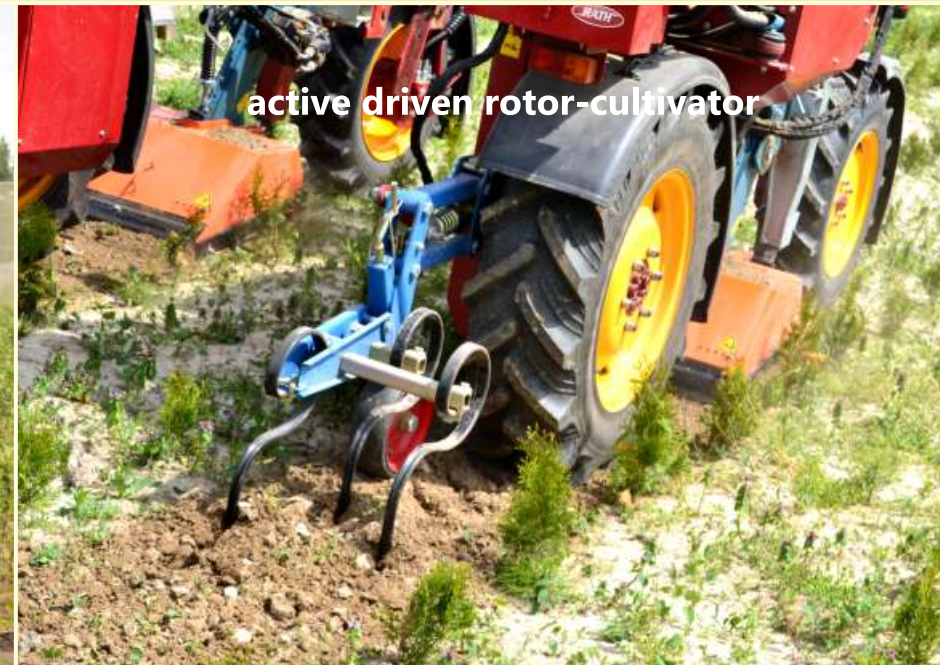
active driven rotor-cultivator