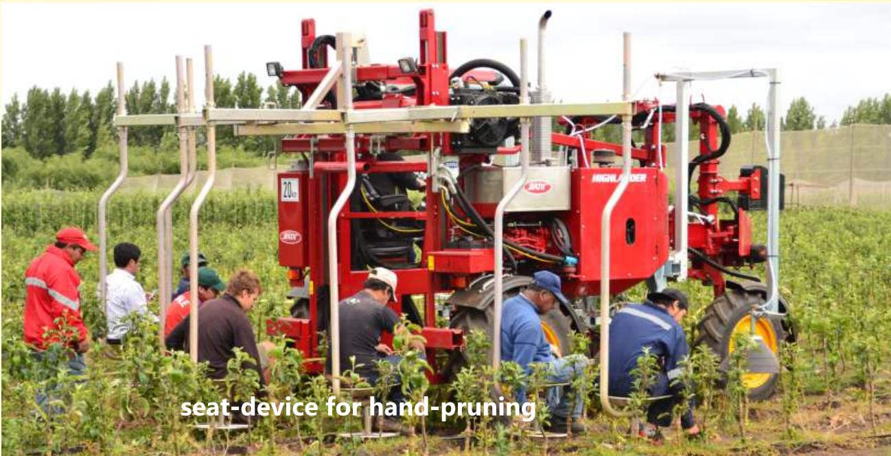
seat-device for hand-pruning