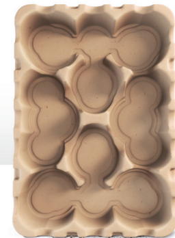
Tray 3x19 cm