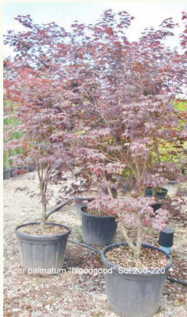
Acer palmatum "bloodgood" Sol.200-220