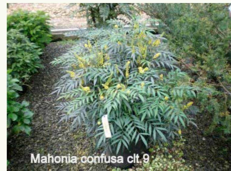
Mahonia confusa cft. 9