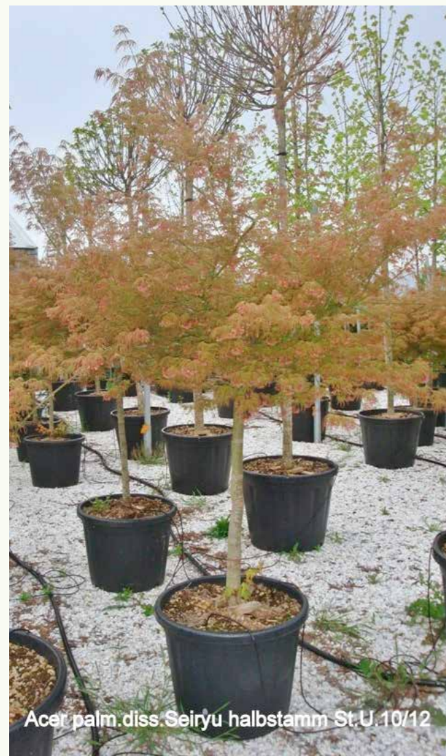
Acer palm. diss. Seiryu halbstamm St. U. 10/12