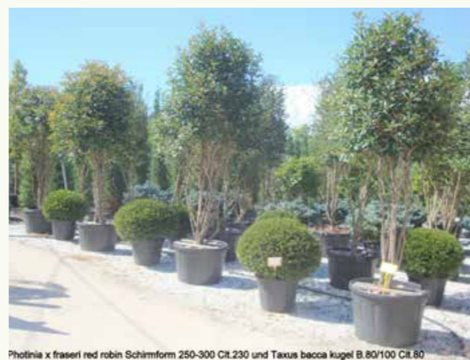
Photinia x fraseri red robin Schirmform 250-300 Clt.230 und Taxus baccata kugel B.80/100 Clt.80