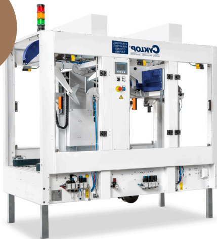
Aut. Klebe- maschinen