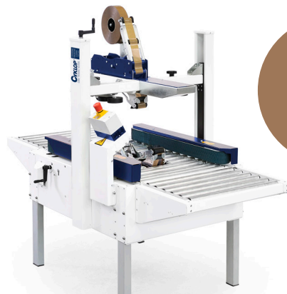
Halbaut. Klebe- maschinen