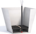
Wassersystem Rotterdam für den Innenbereich