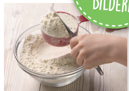
Einfaches Abmessen der Zutaten mithilfe der farbigen Becher