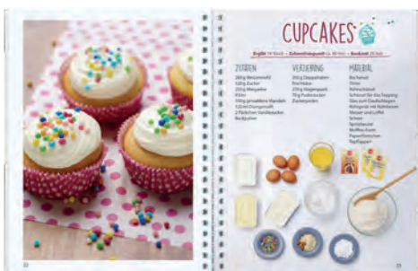
Die Zutaten bereitlegen