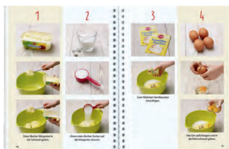
Schritt für Schritt nach Bild- vorlage die Zutaten zum Teig verarbeiten