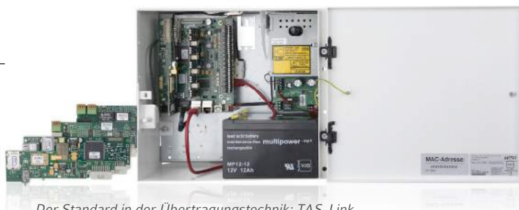
Der Standard in der Übertragungstechnik: TAS-Link

■ Herstellerunabhängiges Sicherheitsmanagement für Gebäude – auf einer Plattform und mit Schnittstellen u. a. zu Gebäudeleittechnik, Videotechnik, Brandmeldesystemen, Einbruch- und Überfallmeldetechnik, Notrufsystemen und zur Aufzugssteuerung.