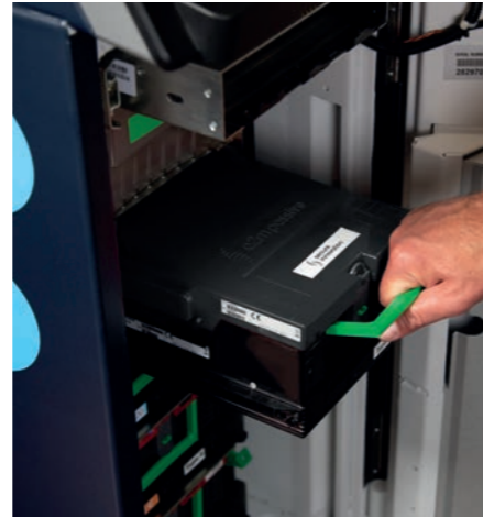
↑ Derzeit sind weltweit über 300.000 patentierte a2m passive™ Kassetten im Einsatz.

Schutz vor Angriffen auf Geldautomaten mit Gasen und Feststoffsprengstoffen.