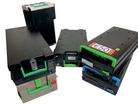
← a2m passive™ ist mit allen gängigen Geldautomatenkassetten kompatibel (siehe Liste unten)