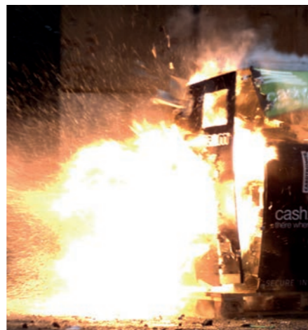
↑ Durch die Wucht der Explosion platzen die a2m passive™ Tinten kapseln im Inneren der Geldautomatenkassette, wodurch das Bargeld sofort wertlos wird.