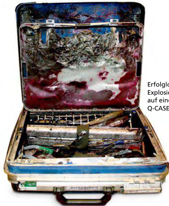
Erfolgreicher Explosionsangriff auf einen Q-CASE 400 C