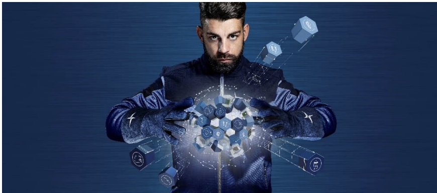
Full Welding Solutions