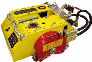
MODELL HE Hydraulisch