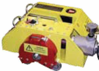
MODELL E Pneumatisch

Die speziellen Fräser von Wachs entfernen während des Schneidens Metall und hinterlassen glatt bearbeitete Rohrenden. Das Vorschubsystem mit einer flexiblen Spannkette passt sich auch unrunder Oberflächen an und liefert gute Ergebnisse im Einsatz vor Ort. Durch die Verwendung einer optionalen Führungsschiene und spezieller Führungsschienenräder kann selbst bei vollständig fehlender Sicht eine Genauigkeit von 0,13 mm für alle Durchmesser erreicht werden. Diese Schneidmethode erleichtert die Entfernung von Abschnitten vor Ort, sodass neue Abschnitte einfach eingesetzt werden können. Der Trav-L-Cutter ermöglicht die Schweißnahtvorbereitung mit dem Standard von 30° und 37,5°. (Sonderanfertigungen auf Anfrage.)