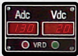
DSP Voltmeter/Amperemeter Schweißen & Kontrollleuchte VRD

Das Bedienteil der Steuereinheit DSP ist mit einem Rundsteckverbinder Typ Militär versehen an den ein MOSA Fernregler oder ein MOSA Drahtvorschub angeschlossen werden kann, zum MIG MAG Schweißen. Beim Einstecken des externen Anschlusses wird die Regelung automatisch auf den Bedienknopf des Fernreglers umgeschaltet.